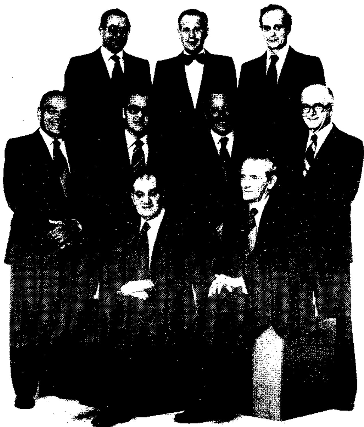
Het bestuur tijdens het 135-jarig bestaansfeest